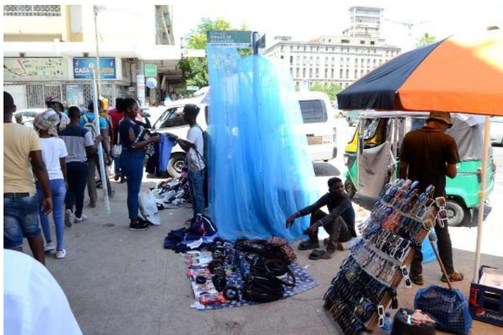
Figura 5-1: Vista de actividades comerciais formais e informais na Cidade de Maputo