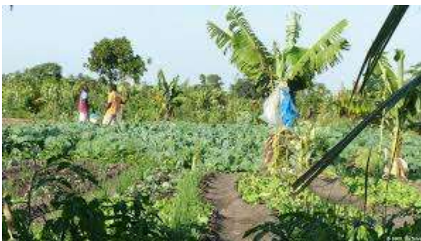
Figura 5-3: Vista de agricultura urbana nos arredores da Cidade de Maputo (Vale do Infulene)

Neste contexto, as intervenções do Projecto poderão implicar: