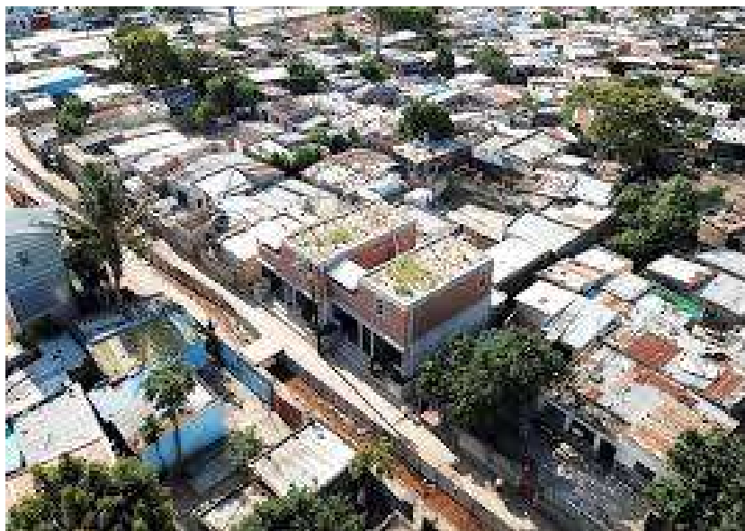
Figura 5-2: Vista de assentamentos desordenados em zonas peri-urbana da Cidade de Maputo